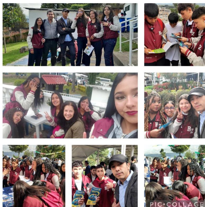
Participación de los estudiantes de grado once en la feria universitaria de la localidad de Suba