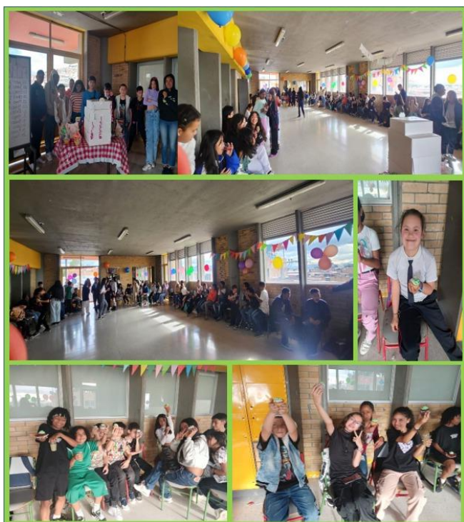
Fiesta de celebración de la Diversidad - Sede C JT.