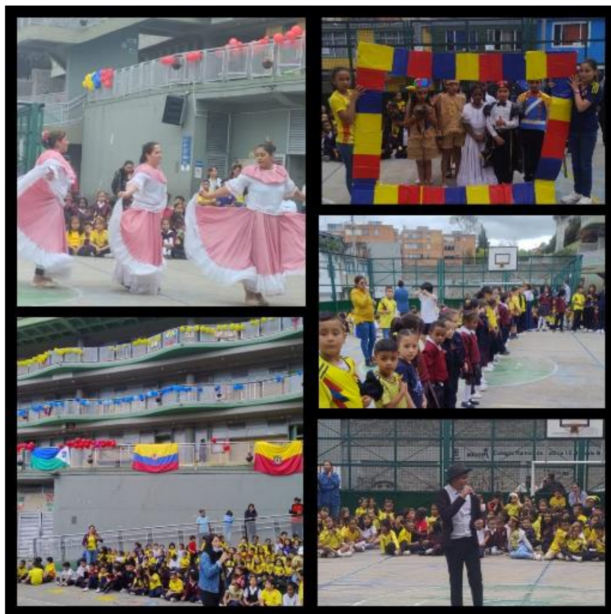
Izada de bandera en Conmemoración del grito de independencia del 20 de julio de 1810. Sede B JM.