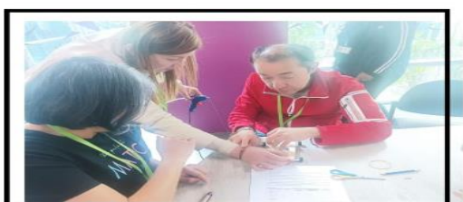
Inauguración de las olimpiadas STEM en Maloka, donde participaron docentes de nuestro colegio Ramón de Zubiría.