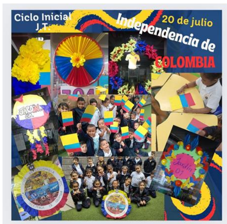
Conmemoración fiestas patrias sede B JM.