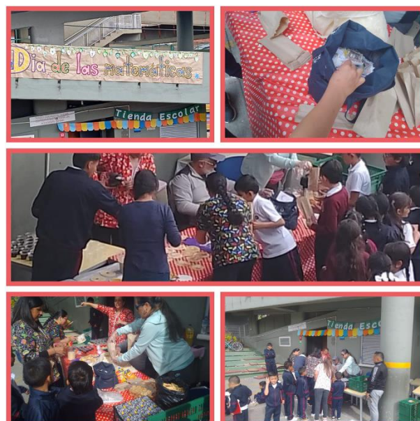
Celebración del día de la matemática sede B JT