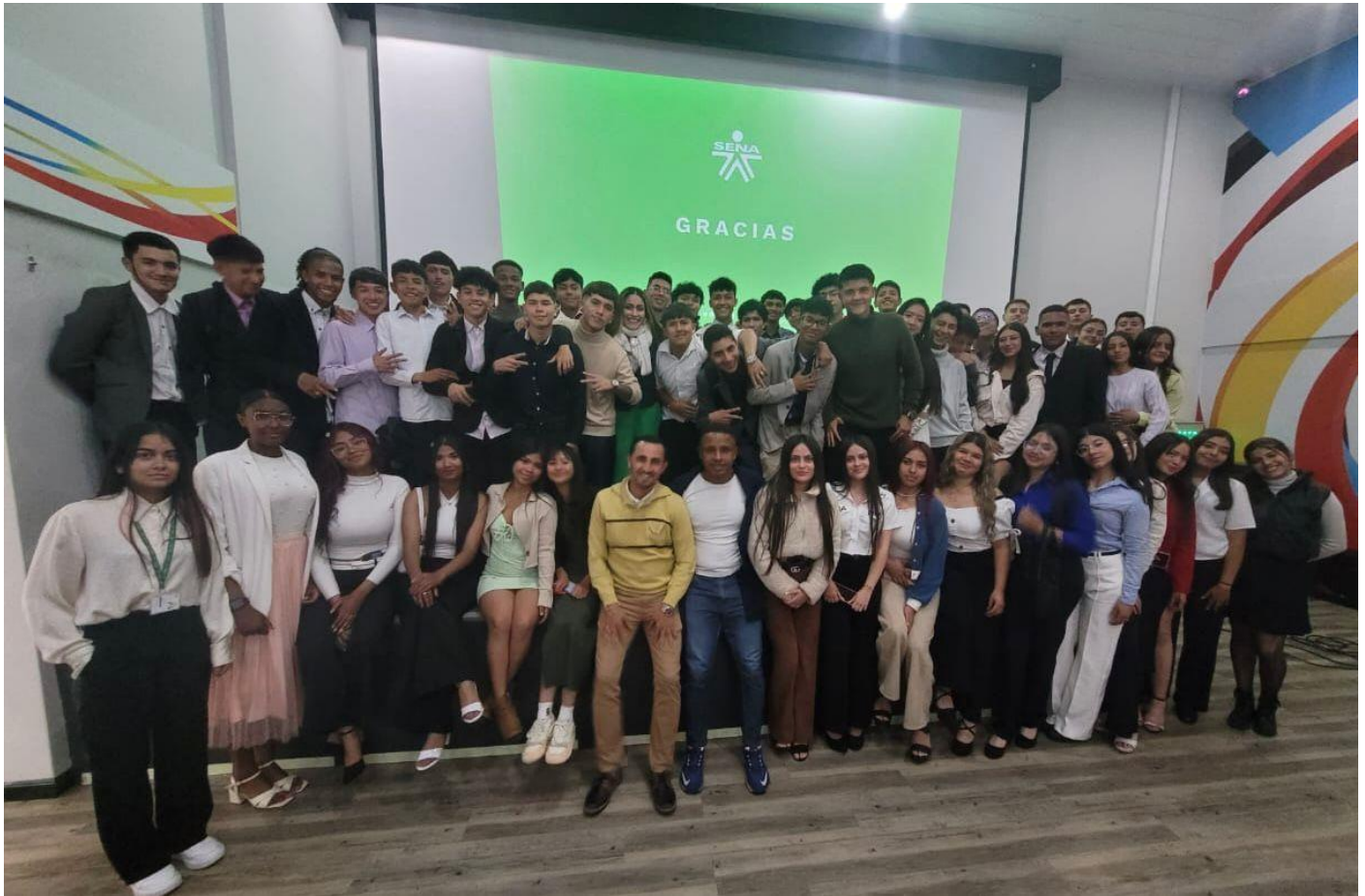
SUSTENTACIÓN TRABAJOS FINALES SENA Técnico en ejecución de programas deportivos. Estudiantes de grado 11, cursos 1103 y 1104.