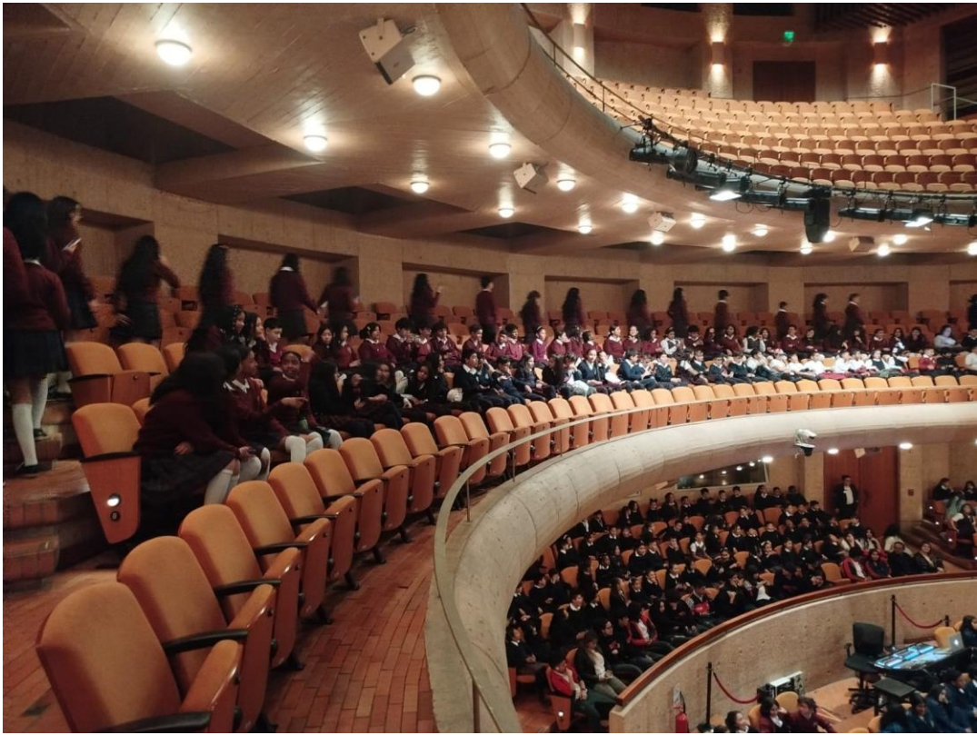
Jornada Tarde - JMSD