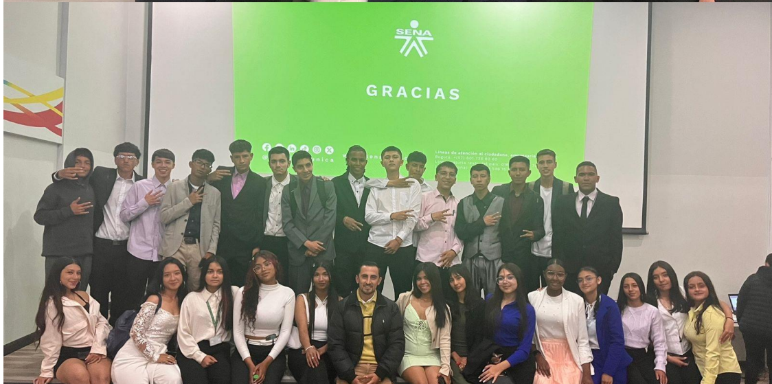
Jueves 17 de octubre socialización líneas de profundización con los cursos de grado 9. Sede C JM 9:00 am/12 m. Sede C JT 12:30 m/ 3:00 pm. La organización fue compartida por correo a los coordinadores sep. 17.