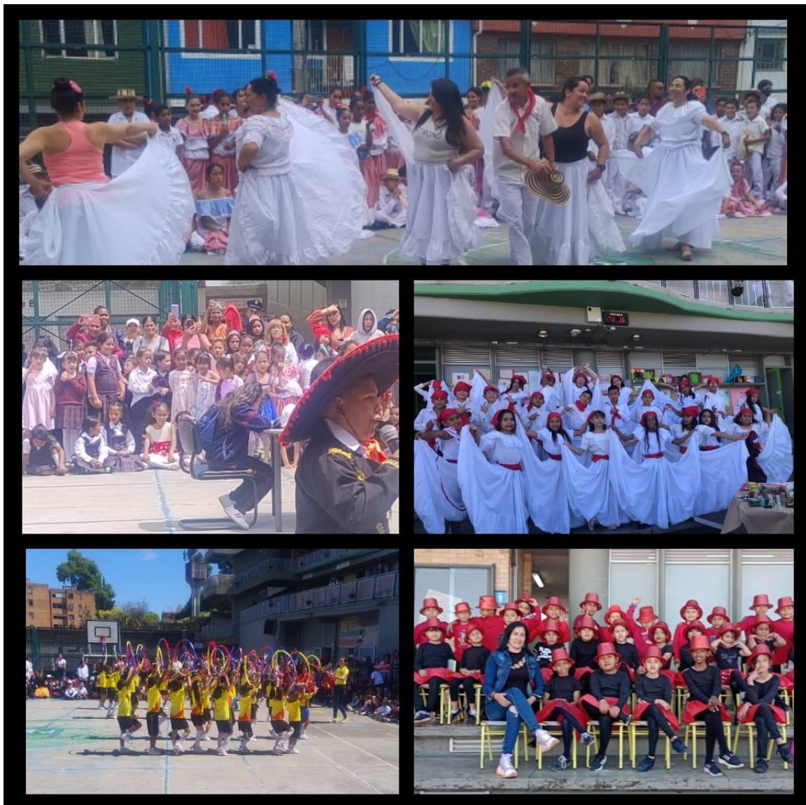
Festival de Danzas SB JM