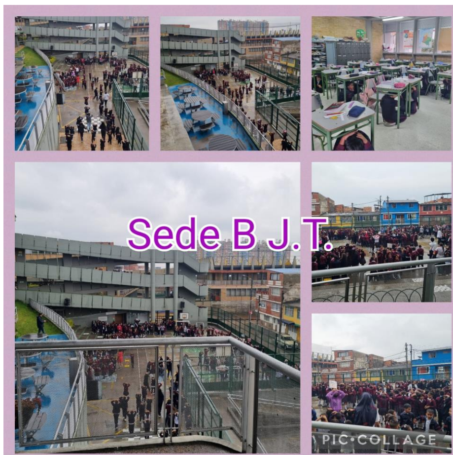
Simulacro Distrital Sede B J.T

Agradecimiento a todos los docentes en la organización, preparación y realización del simulacro distrital.