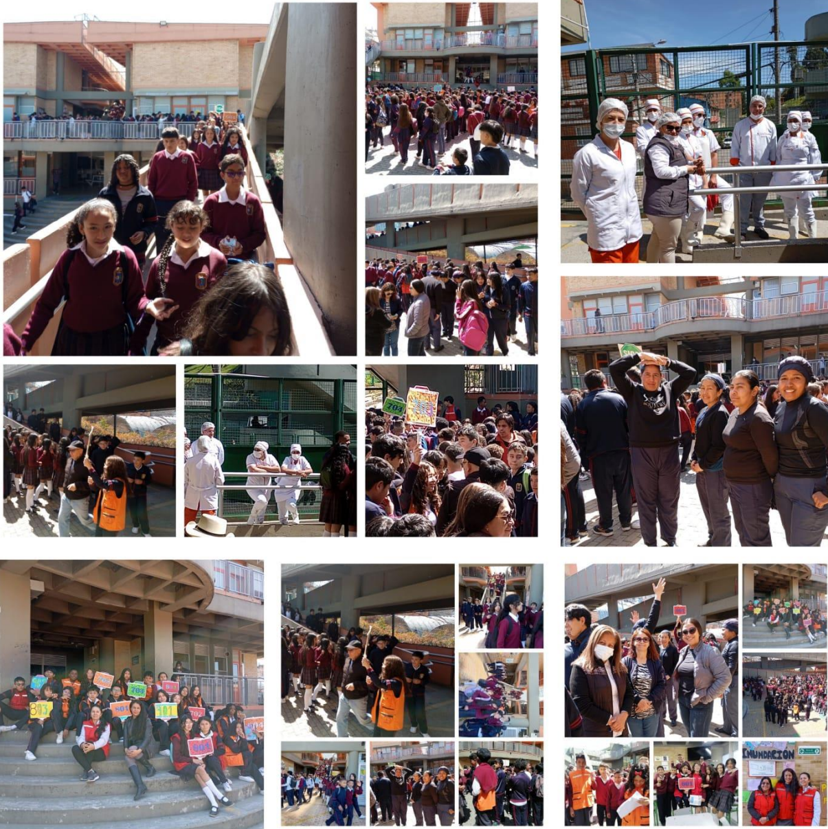
Simulacro de evaluación desarrollado en la sede C JM