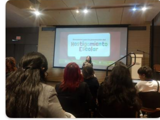
Participación en el encuentro de hostigamiento escolar de la oficina de convivencia de la SED y Cámara de Comercio 5/6 de Noviembre 2024