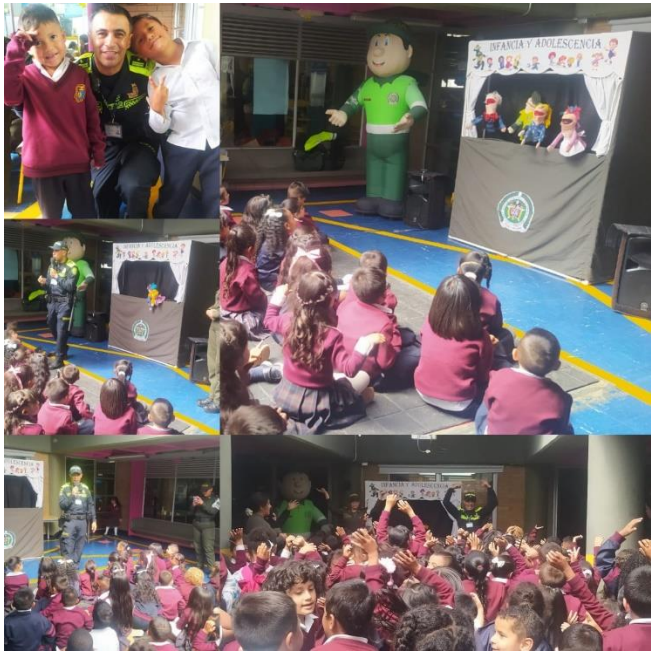
Evento con policía de infancia y adolescencia, prevención abuso sexual infantil SB JM