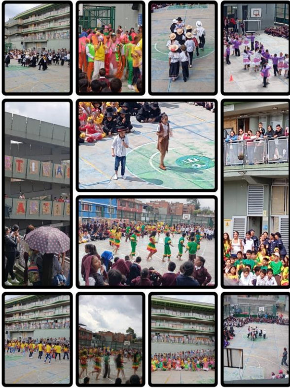
Festival artístico sede B JT