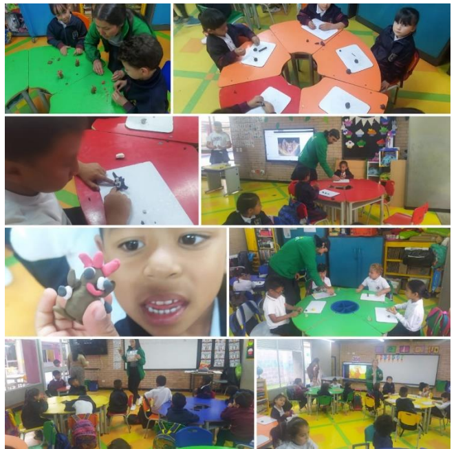
Actividad de pre escolar SB JM con la secretaria de ambiente.