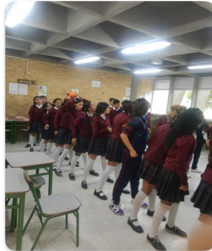
Convivencias proyecto de educación sexual grados 6 y 7 sede C JM