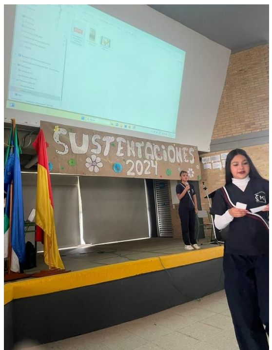
Sustentación de proyecto de la Media.