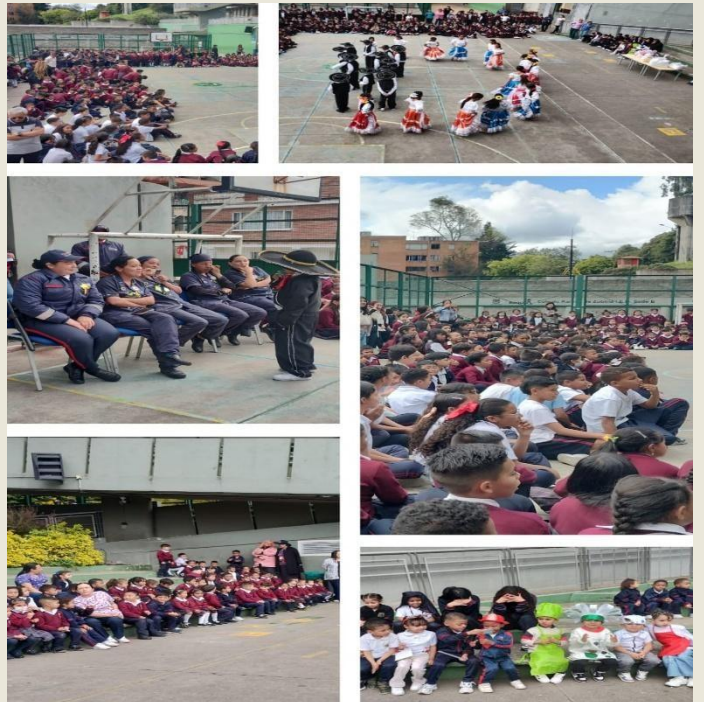
Commemoración "Día del Trabajo" Sedes A JM y B JT