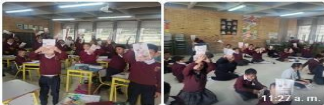
Entrega de kits "Doctor muelitas" Colgate 12/05/26 11:27 a. m.