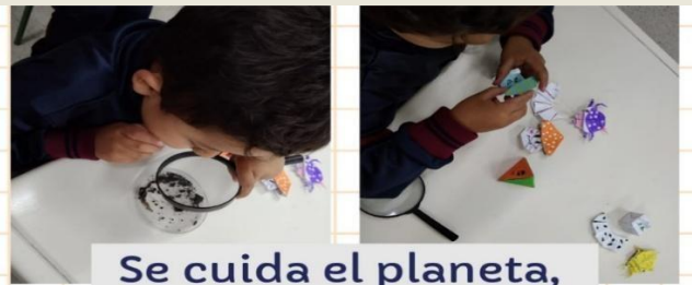
Visita a la compostera