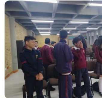
Taller de gestión emocional. Orientación