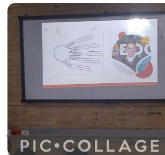
Taller de gestión, emocional con grados séptimo sede C jornada mañana. A cargo de orientación.